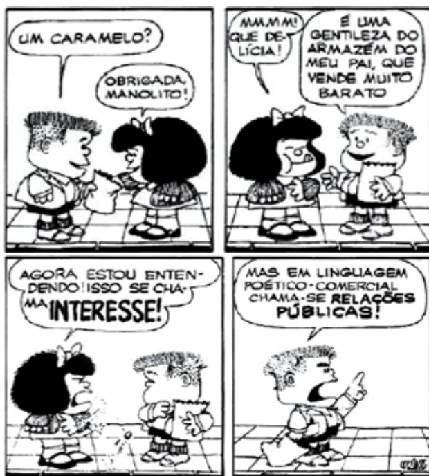
QUINO, Mafalda. São Paulo: Martins Fontes, 1992, p.: